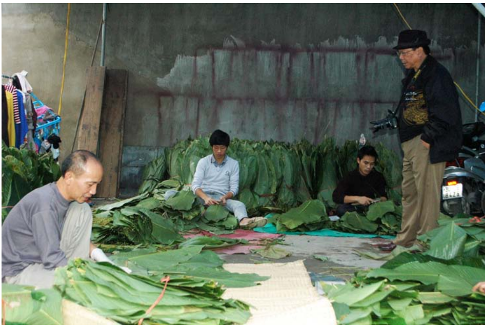
Thăm làng truyền thống nấu bánh chưng Tranh Khúc.