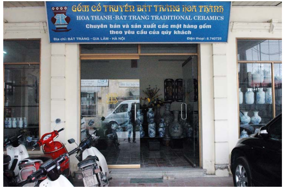
Thăm làng truyền thống gốm sứ Bát Tràng.