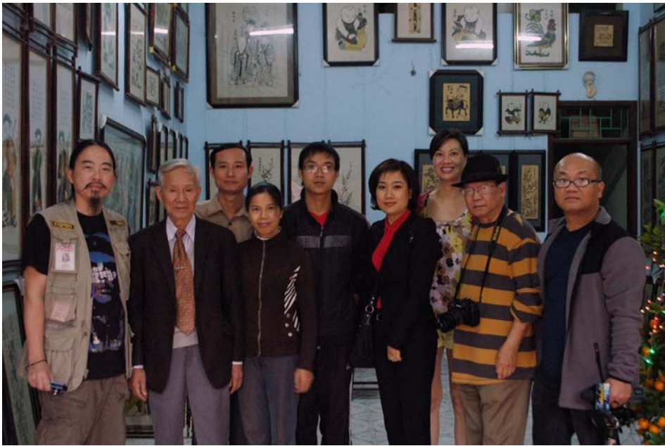
Thăm làng tranh Đông Hồ.