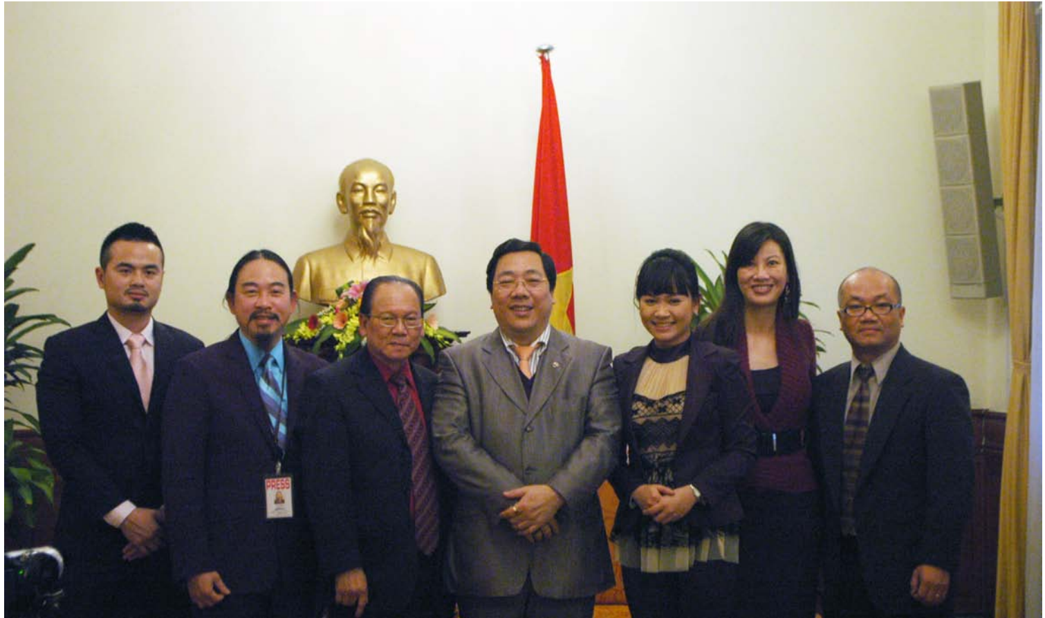
Thứ trưởng ngoại giao Nguyễn Thanh Sơn (giữa) tiếp và trả lời phỏng vấn đoàn báo chí.

Sau hơn 3 giờ bay chuyến bay EVA BR397 đã đáp xuống phi trường Nội Bài. Một lần nữa sân bay Nội Bài lại tiếp đón rất nhiều những người con yêu của đất nước trở về với những hương vị quê hương sau 36 năm biệt xứ ly hương. Người Mỹ có câu “No place better than home” có lẽ rất đúng trong trường hợp này. Những người Việt Nam ở hải ngoại trở về để tìm lại không khí đầm ấm đây ấp hương vị tình tự quê hương. Hải ngoại dù có cao lương mỹ vị và vật chất dư thừa vẫn không bằng những cái nghèo tết dù mộc mạc đơn sơ nhưng đậm tình dân tộc.