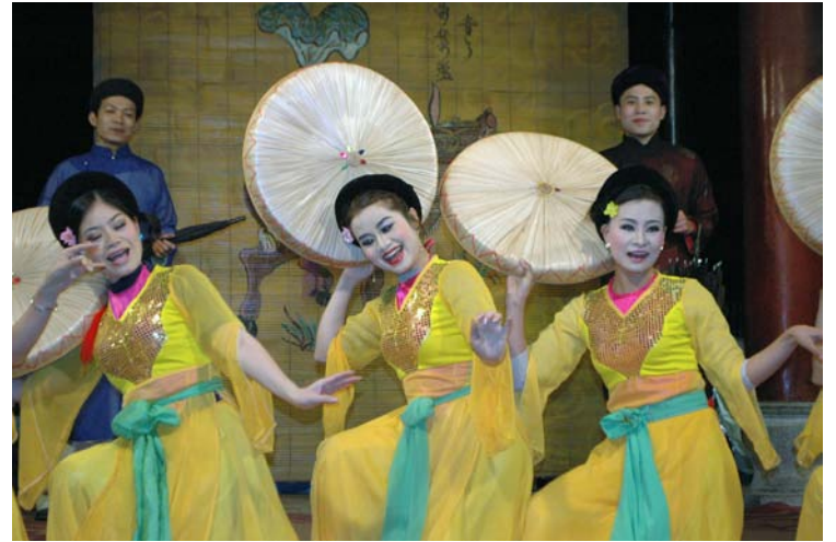
Xem hát chèo ở Đền Ngọc Sơn.

Song song với chương trình văn nghệ cổ bên ngoài hồ Hoàn Kiếm tại ngã ba dẫn vào phố Cổ trước đền Ngọc Sơn cũng có một sân khấu to lớn trang hoàng lộng lẫy không kém gì sân khấu hội chợ Tết sinh viên tại Nam California. Chương trình văn nghệ hoàn toàn thuần túy tân nhạc, nhạc vàng (trước 1975 và được phép trình diễn), nhạc techno với những màn đơn ca, song ca, tứ ca, hợp ca, hài hước... như những chương trình đại nhạc hội. Nhưng tất cả đặc biệt đều hoàn toàn công cộng. Trong phần trình diễn có màn biểu diễn break dance của một nhóm trẻ khoảng 10 người trong đồng phục áo T-shirt màu xanh lá cây. Chương trình tân nhạc cũng chấm dứt lúc 11 giờ 50 khuya.