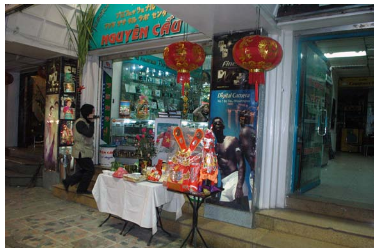
Một cửa hàng cúng giao thừa.