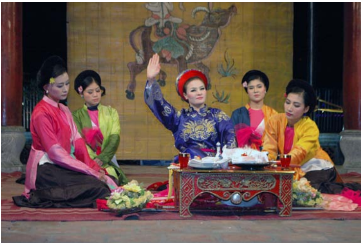
Xem trình diễn lên đồng trong đêm giao thừa.

ngôi Đồng... do các thanh thiếu nam nữ đảm trách. Chương trình rất hấp dẫn vì phần trình diễn được phối hợp rất nhịp nhàng giữa nghệ thuật âm nhạc và nội dung diễn tả bằng những trang phục và điệu múa uyển chuyển dịu dàng của các nghệ nhân nam nữ vũ công. Chương trình được diễn liên tục từ 10 giờ tối đến 11 giờ 50 mới chấm dứt để chuẩn bị cho lễ mừng Giao Thừa.